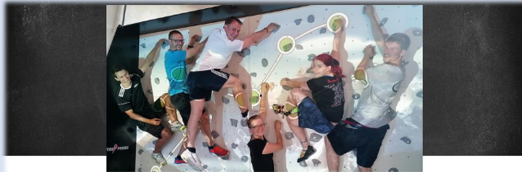
Vorstand der Sportjugend des Kreissportbundes LUP