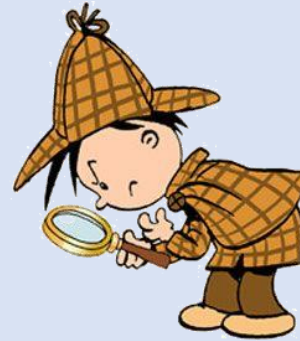
Sportfest für kleine Detektive