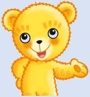
BummiSportSpiele Für Kitas und Sportvereine